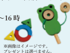
※画像はイメージです。プレゼントは選べません。

イベントに関するお問い合わせ 三之瀬御本陣芸術文化館 TEL: 0823-70-8088 FAX: 0823-70-8044