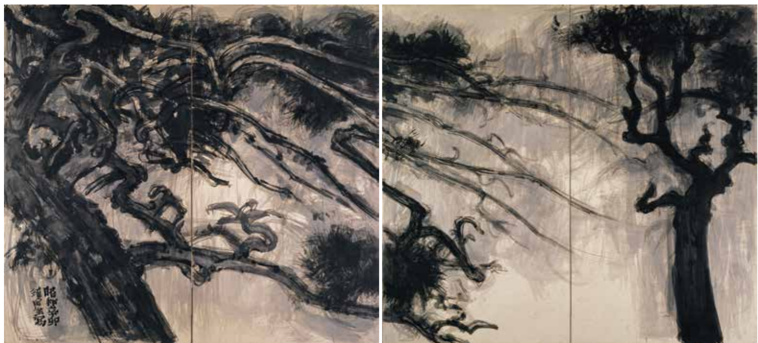
《老松》京都市美術館蔵 1951年 紙本墨画・二曲一双